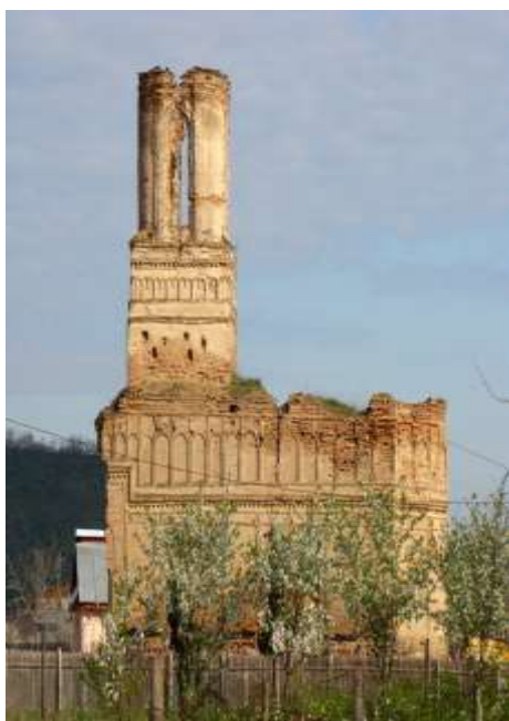
Foto nr. 1 Biserica Domirești

Valea râului Râmnicu-Sărat, în prezent, nu constituie un obiectiv de atracție turistică și acest lucru nu datorită lipsei de peisaje încântătoare sau prezenței unor monumente istorice și ale naturii, cauza fiind lipsa de interes a unor organe locale, cât și insuficienta cercetare științifico-turistică de către cei cu drept. Situația acestei zone la confluența celor trei provincii românești, dincolo de granițele administrative, impuse de cursul zbuciumat al istoriei noastre, domnește prin legăturile dintre cele trei provincii și prin bogatul material de cultură populară, manifestat în cele mai diverse domenii (de la ocupații, meșteșuguri, gospodărie până la arhitectură, port, obiceiuri, folclor). Având în vedere importanța excursiilor în procesul de însușire a cunoștințelor de către elevi și cunoașterea mediului natural al orizontului local am organizat o excursie didactică cu elevii clasei a VIII-a în orizontul local, cu durata de o zi, care a avut un profil interdisciplinar. Iată două dintre obiectivele turistice care pot fi vizitate.